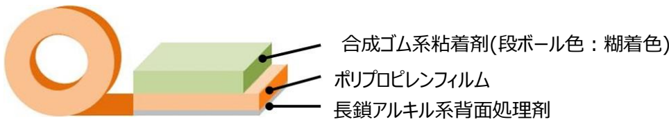
図 MR-3603 テープ構成